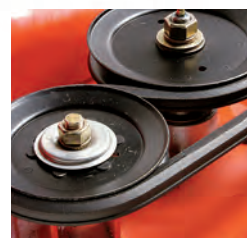
Zeer duurzame zesvoudige V-snaar met lange levensduur