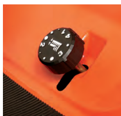
Maaier met zijuitworp Gemakkelijk bereikbare instelknop voor de maaihoogteverstelling