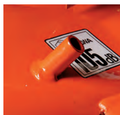
Aansluiting waterslang voor reiniging maaidek