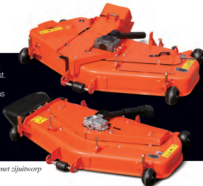
Maaier met zijuitworp

Met de reputatie van grote prestaties die ons Direct Chute system heeft, is het vanzelfsprekend dat de GR2120 ermee werd uitgerust. In tegenstelling tot andere 3-messen maaiers met zijuitworp die een turbine gebruiken, wordt met het Direct Chute System het gras efficiënt gemaaid en direct naar de achterop geïntegreerde grasopvangbak gestuurd. De maaibreedte van het maaidek bedraagt ruim 1,20 meter en omdat aan beide zijanten geen afvoerkanal zit, is het mogelijk om zeer korte wendingen in beide richtingen, b.v. rondom bomen te maken.