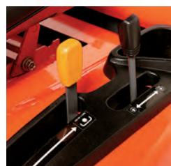
Hendel voor het hydraulisch heffen van het maaidek